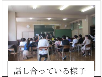
話し合っている様子

児童会集会も「心がほかほか」になる内容を考えているそうです。子供たちと一緒に「心はほかほか 学びはしっかり からだははつらつ」な学校づくりを進めてまいります。子供たちのこれからの活躍をどうぞ楽しみにしててください。