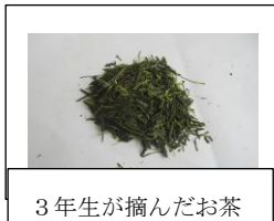
3年生が摘んだお茶

5年生が家庭科でお茶を入れる学習をした時に、3年生が摘んだお茶を使わせていただきました。自分たちが住んでいる湯河原町のお茶を使って学習でき、とても贅沢なひと時を過ごさせていただきました。